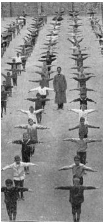
Exercicis de gimnàstica a l'escola del Patronat Obrer (Vida Isleña, 1912)

Edita: Àrea de Teoria i Història de l'Educació. Universitat de les Illes Balears.